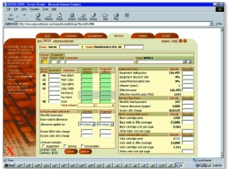
XOPA-Seiten mit Gerätekostendetails – Beispiel